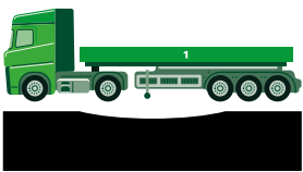
Pavimentazione in asfalto